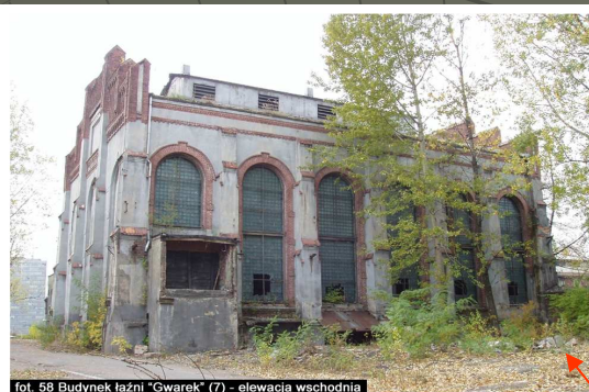
fol. 58 Budynek łaźni "Gwarek" (7) - elewacja wschodnia