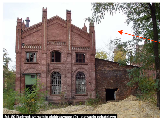
fol. 80 Budynek warsztatu elektrycznego (9) - elewacja południowa