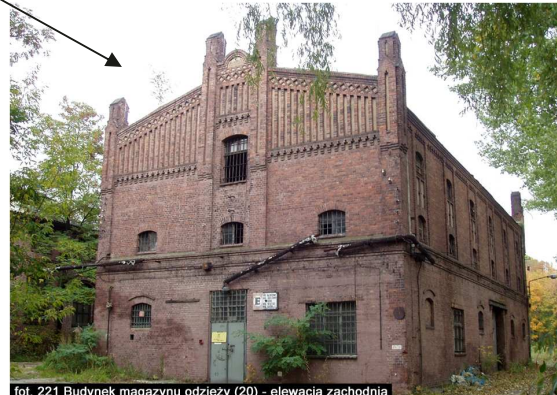
fol. 221 Budynek magazynu odzieży (20) - elewacja zachodnia