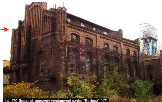
fol. 170 Budynek maszyny wyciągowej szybu "Bartosz" (17)