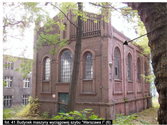
fol. 41 Budynek maszyny wyciągowej szybu "Warszawa I" (6)