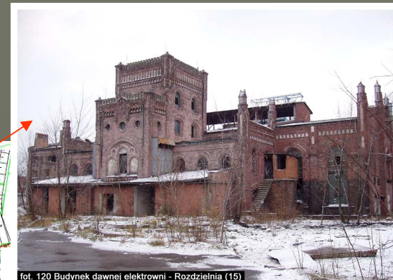
fol. 120 Budynek dawnej elektrowni - Rozdzielnia (15)