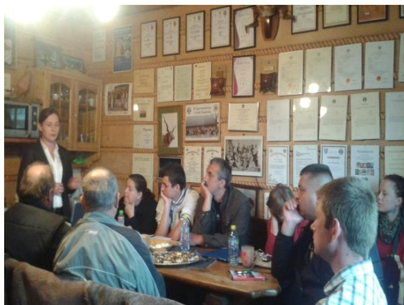
fot. Warsztaty promujące zawód bacy i juhasa (2014 r.). . Zajęcia teoretyczne.