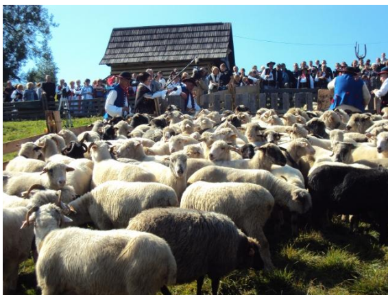
Liczenie jesienne.