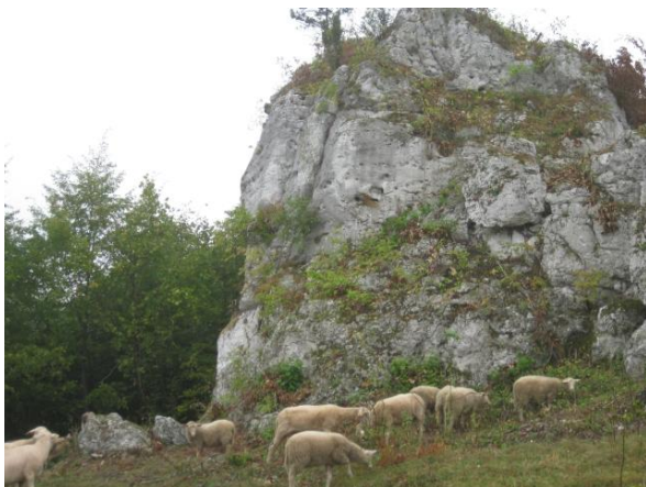
fol. Wypas na Jurze Krakowsko- Częstochowskiej.