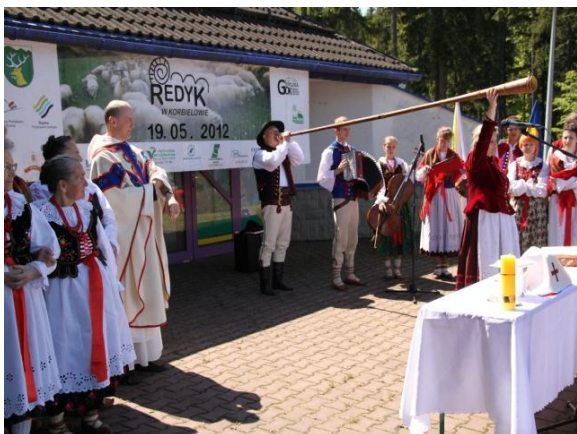
fot. Otwarcie Redyku.