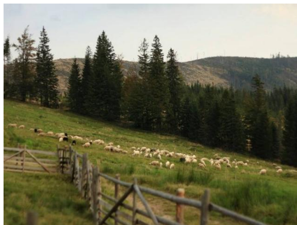
fol. Wypas w Beskidach.

- Odkrzaczanie – „intensywnie postępująca sukcesja drzew i krzewów na tereny nieleśne powoduje ich zarastanie i zmniejszanie przez to różnorodności biologicznej. (...) Zabieg odkrzaczania kształtuje strefę ekotonalną z lasem w formie przejściowych pasów o stopniowo przerzedzanym zwarcie drzew i krzewów, a także różnicuje i wzbogaca skład gatunkowy poprzez tworzenie układów mozaikowych”. 4