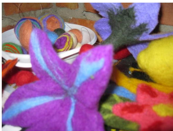
fot. Możliwości wykorzystania wełny owczej.

Podczas imprez promujących Program Owca Plus, każdy zainteresowany ma możliwość zdegustowania produktów pochodzenia owczego i koziego: serów (oscypki, bundz owczy i kozi, bryndza, żyntycza, redykołki), mleka koziego, jagnięciny podhalańskiej. Ponadto organizowane są pokazy, podczas których można zapoznać się z technologią uszlachetnienia wełny, metod jej przerobu oraz wyrobu z niej rzeczy użytkowych np. swetrów, skarpet, elementów strojów ludowych (np. zapaska, gunia, kożuszek). W bacówkach natomiast można zakupić produkty pochodzenia owczego i koziego, a ponadto naocznie obcować z kulturą pasterską.