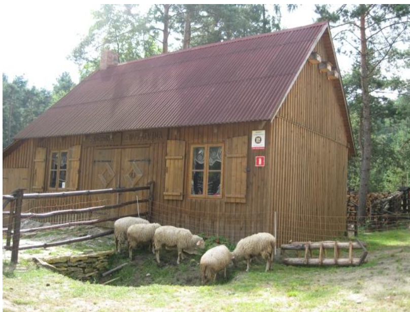
fol. Zagroda Edukacyjna na Jurze Krakowsko- Częstochowskiej.

Podobna budowla powstała także na Jurze. Stanowi ona dopełnienie istniejącej zabudowy złożonej z Zagrody Edukacyjnej (realizacja w ramach Programu w 2008 r.) oraz budynku Centrum Dziedzictwa Przyrodniczego i Kulturowego Jury. Można w niej nabyć sery oraz wyroby z filcu, a także wziąć udział w warsztatach z tkactwa i rękodzielnictwa.