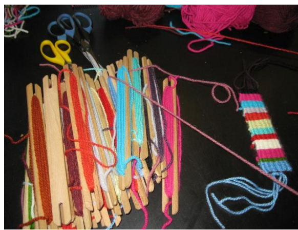
fot. Możliwości wykorzystania wełny owczej.