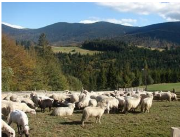
fot. Owce w koszorze.

Działalność pasterska na terenie Beskidów i Jury Krakowsko- Częstochowskiej ma bardzo bogatą tradycję. Wypas zwierząt ma duży wpływ nie tylko na ukształtowanie terenu i przyrodę, ale także na kulturę obu tych regionów. W wyniku podejmowanych prób powrotu tradycji pasterskich w Beskidach i na Jurze Krakowsko- Częstochowskiej, pasterstwo, w rozumieniu działalności gospodarczej może mieć wpływ na rozwój ekonomiczny gmin, pozytywnie oddziałując przy tym na lokalne zasoby przyrodnicze. Pasterstwo to nie tylko wypas, to także wieloaspektowy rozwój innych sfer aktywności rynkowych.