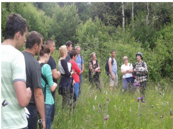
fot. Warsztaty promujące zawód bacy i juhasa (2014 r.). Rozpoznawanie roślinności.