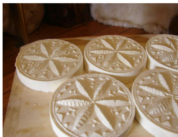
fot. Sery owcze.