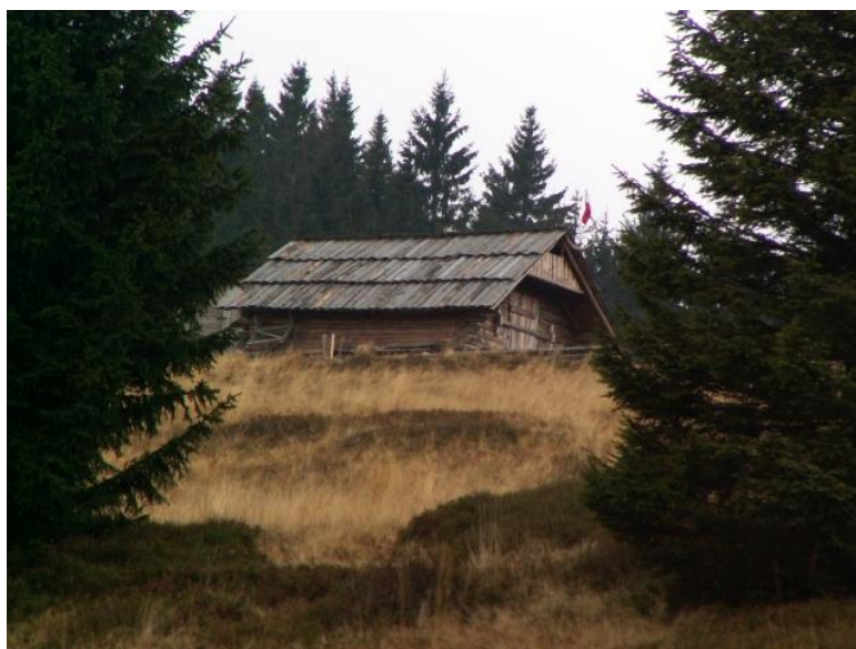
fot. Baczówka na Hali Rycerzowej.

W okresie realizacji Programu Owca Plus na lata 2010-2014 zmodernizowano i rozbudowano infrastrukturę turystyczną w celu zwiększenia dostępności i uatrakcyjnienia terenów włączonych do Programu. Przygotowano m.in. miejsca odpoczynku dla turystów wyposażone w ławki, ławo-stoły i zadaszenia. Ustawiono tablice informacyjne w miejscach atrakcyjnych krajobrazowo lub przyrodniczo. W Beskidach, w ramach Programu, wybudowano nowe baczówki i odremontowane stare. Obiekty te usytuowane są w pobliżu szlaków turystycznych, co podnosi atrakcyjność tych terenów oraz umożliwia turystom zakup produktów owczych. Najpiękniejsze baczówki znajdują się m.in. na Hali Ochodzitej, Muńcole, Rycerzowej oraz Hali Boraczej.