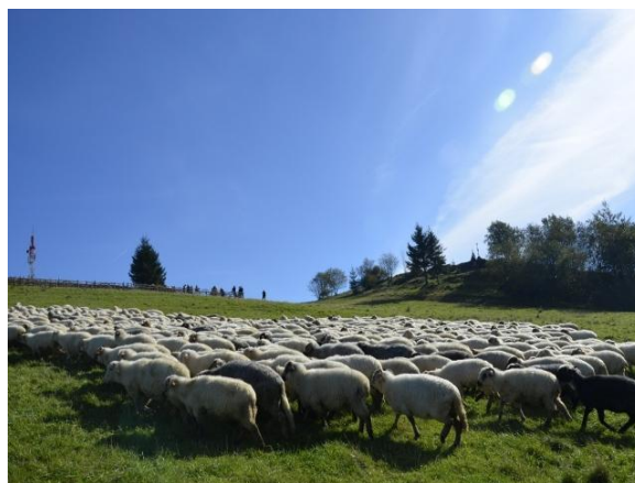
fot. Wypasające się owce.