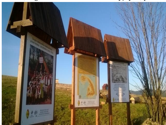
fot. Tablice informacyjne w Beskidach

Program przewiduje także budowę infrastruktury turystycznej tj. miejsc odpoczynku dla turystów, ścieżek, zagród i warsztatów edukacyjnych, punktów widokowych, itp.