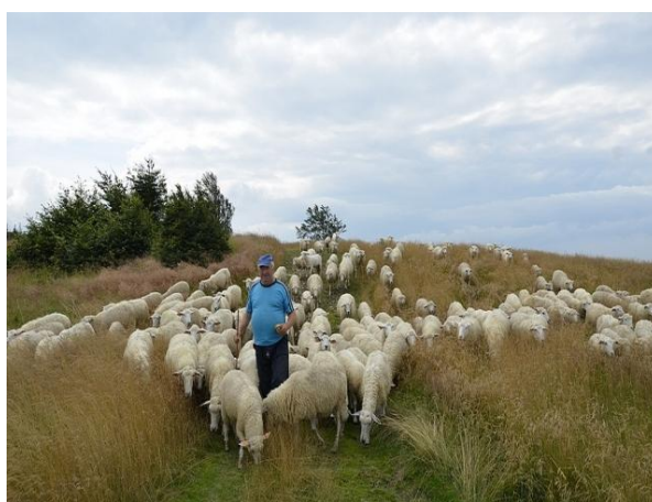
fot. Wypasające się owce.

Należy także podkreślić, że znaczący efekt społeczno- kulturowy dla kultury Jury Krakowsko- Częstochowskiej miała zainicjowana w ramach Programu i realizowana od 2009 roku impreza „Jurajskie Regionalia”. W Beskidach natomiast, do roku 2007 organizowane były: Redyk w Korbielowie i Łossod w Węgierskiej Górze. Realizacja Programu Owca Plus stworzyła między innymi możliwość powrotu tradycji pasterskich, takich jak: „Mieszanie owiec na Stecówce”, Strzyżenie Owiec, Muzyka na Sałaszu, które na stałe wpisały się w kalendarz wydarzeń kulturalnych.