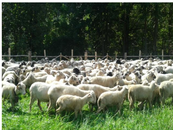
fot. Wypasające się owce.

Nie można także zapominać o upowszechnianiu tradycji pasterskich i dziedzictwa kulturowego regionu wśród osób odwiedzających Jurę Krakowsko- Częstochowską i Beskidy. Wypasające się na murawach i pośród skalnych ostańców owce i kozy, już na stałe wpisały się w krajobraz regionu, co dla przyjeżdżających turystów na tereny Jury Krakowsko- Częstochowskiej jest sporą atrakcją. Równie atrakcyjne dla turystów są stada owiec wypasające się na halach Beskidów pod czujną opieką juhasów, holejników i towarzyszących im psów. Wszystko to znacząco przyczyniło się do szerzenia kultury pasterskiej w skali całego kraju i poza jego granicami.