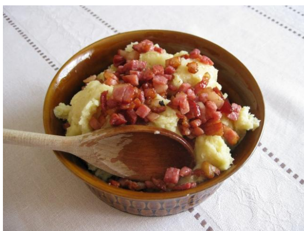
fot. Kluchy połam bite.

będą występy zespołów regionalnych prezentujących twórczość ludową, a także wystawy i pokazy rękodzieła i rzemiosła. Kultura pasterska to nie tylko zwyczaje związane z wypędem i spędem owiec, ale również piękne pieśni pasterskie, które towarzyszą bacom podczas wypasu. Obecnie można ich posłuchać podczas Festiwalu Pieśni Pasterskich. Z kolei na Jurze, organizowane będą m.in. Jurajskie Regionalia, podczas których będzie można wziąć udział w pokazach filcowania, tkania, bibułkarstwa, a od niedawna także w pokazie strzyżenia owiec. Ponadto, każdy chętny spróbuje tradycyjnej kuchni lokalnej m.in., kwaśnicy, serów owczych podawanych na różne sposoby, jagnięciny po beskidzku, kluch połam bitych. Utrzymanie walorów przyrodniczych i krajobrazowych terenów otwartych poprzez prowadzenie wypasu wymaga popularyzacji tej formy działalności rolniczej wśród młodego pokolenia. W ramach Programu Owca Plus planuje się realizację działań adresowanych do dzieci i młodzieży szkolnej, których celem będzie krzewienie wiedzy na temat pasterstwa, owczarstwa i tradycji regionalnej. Będą to np. spotkania i warsztaty edukacyjne czy konkursy tematyczne, które będą wpisywać się w zakres edukacji regionalnej.