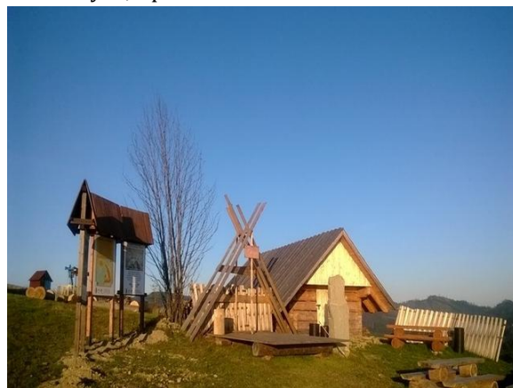
fot. Infrastruktura turystyczna w Beskidach