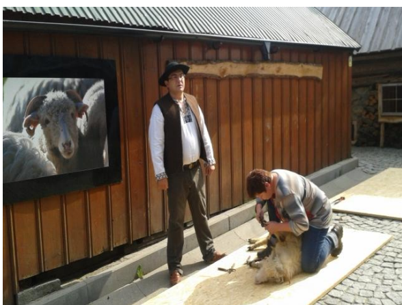
fot. warsztaty promujące zawód bacy i juhasa (2014 r.). Zajęcia praktyczne .