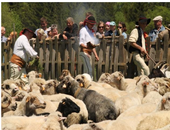
fot. Redyk. Mieszanie owiec.