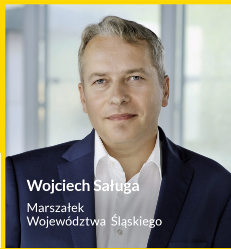
Wojciech Saługa Marszałek Województwa Śląskiego

Regionalny Program Operacyjny Województwa Śląskiego na lata 2014-2020