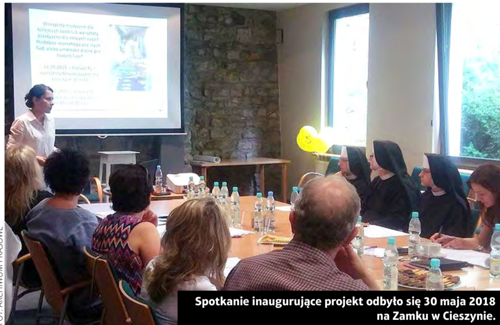
Spotkanie inauguracyjne projektu odbyło się 30 maja 2018 na Zamku w Cieszynie.