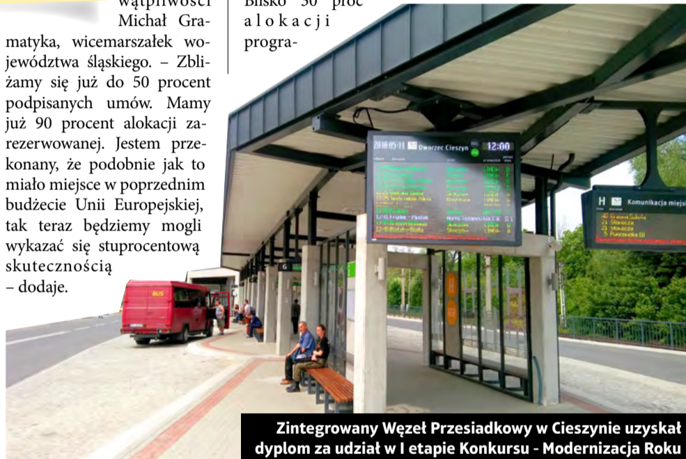
Zintegrowany Węzeł Przesiadkowy w Cieszynie uzyskał dyplom za udział w I etapie Konkursu - Modernizacja Roku