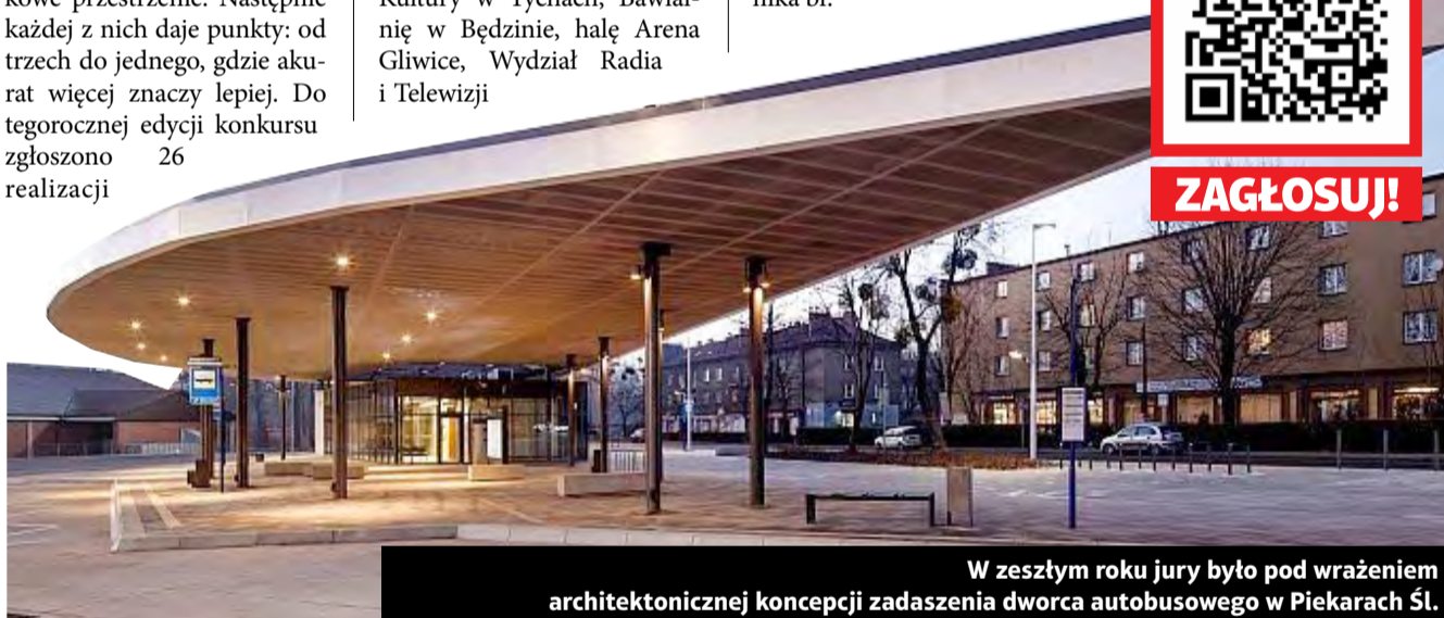
W zeszłym roku jury było pod wrażeniem architektonicznej koncepcji zadania dworca autobusowego w Piekarach Śl.