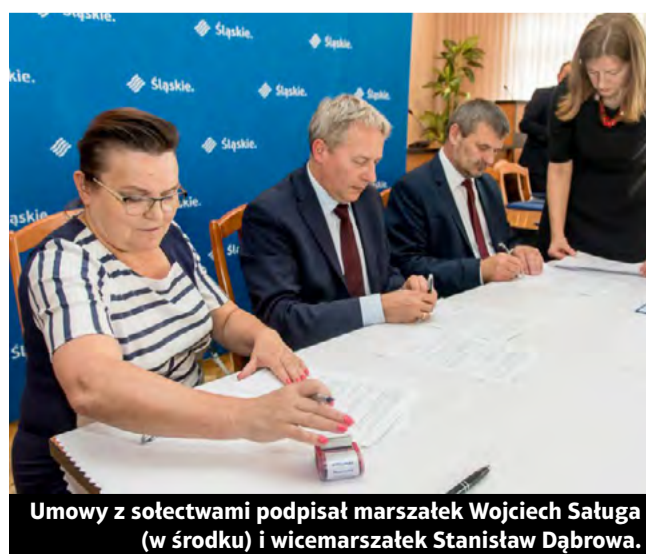
Umowy z sołectwami podpisał marszałek Wojciech Saługa (w środku) i wicemarszałek Stanisław Dąbrowa.

Dąbrowa, wicemarszałek województwa śląskiego. Dzięki Konkursowi Przedsięwzięć Inicjatyw Lokalnych sołectwa z terenu województwa śląskiego mają szansę zrealizować te inwestycje, które wedle tamtejszej społeczności są najpilniejsze. Wśród dofinansowanych zadań znalazły się zarówno te duże, jak np. przebudowy dróg i chodników, budowy placów zabaw, renowacje skwerów, jak i małe, np. doposażenie świetlic, zakup strojów ludowych, instrumentów muzycznych czy wydarzenie integrujące lokalną społeczność